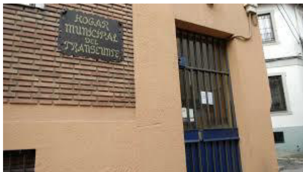
Hogar Municipal del Transeúnte. C/ Panaderos 5, 24006 LEÓN

Todos los trabajos y servicios serán realizados por los participantes en los programas de empleo y formación bajo la supervisión del personal docente de dichos programas.