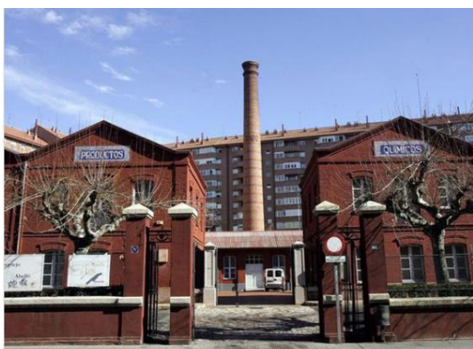
Edificio Abelló. C/ Astorga nº20 24009 LEÓN