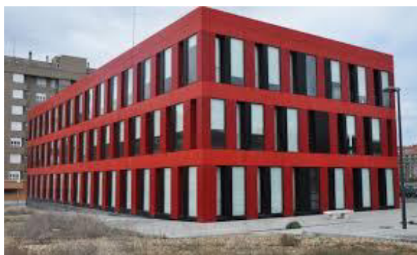
Centro de empresas de base tecnológica, CEBT. C/ Santos Ovejero 1 24008 LEÓN