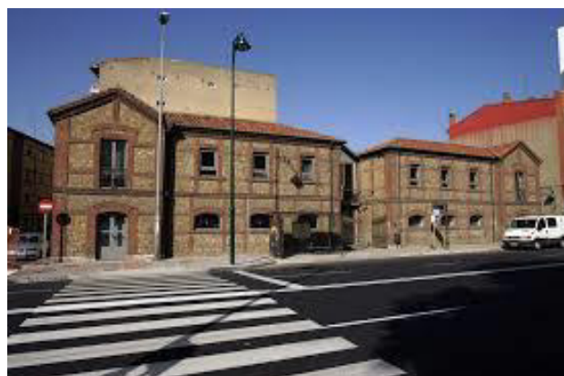
Vivero de empresas. Avda. de la Magdalena,9 24009 LEÓN