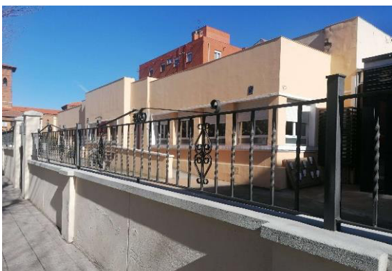
Escuela Municipal de Hostelería. Avda. Mariano Andrés 66 24009 LEÓN